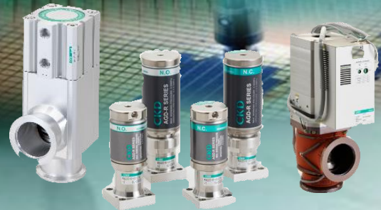
DRY FINE SYSTEM